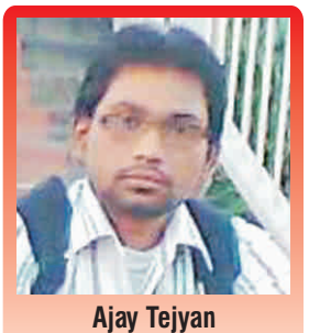
Jr. Electrical Engg. UPPCL, Noida